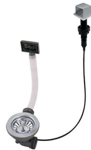
Vidange automatique LIRA 8407 103