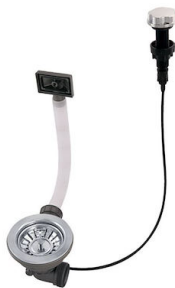
Vidange automatique 8407 000