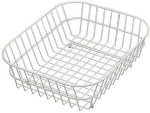
Panier en acier inoxydable 8612 000